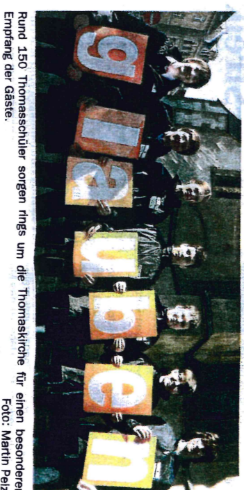
Rund 150 Thomasschüler sorgen rings um die Thomaskirche für einen besonderen Empfang der Gäste.

Nur einer schaut zumindest zwischenzeitlich etwas säuerlich drein, nimmt's